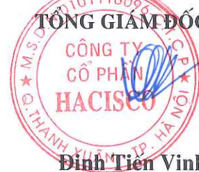
Đinh Tiên Vinh